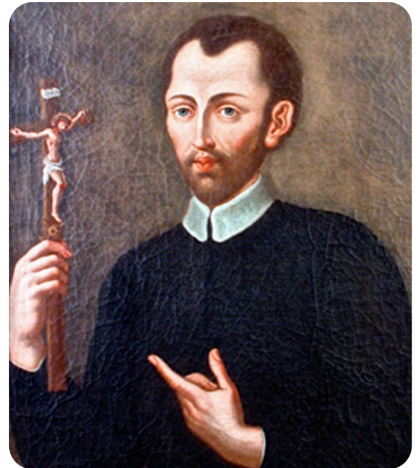
San Alfonso María de Liguorio

Al considerar el Sagrado Corazón de Jesús y el gran amor de Cristo por la humanidad, reflexionamos sobre cómo hemos fallado en alcanzar su amor y la necesidad de expiar nuestros pecados. También aprovechamos este momento para arrepentirnos como nación por los pecados del pasado de nuestro país. Oremos por el perdón y la sanación de los daños causados por los pecados originales de la esclavitud y el racismo de nuestra nación. Un elemento central de la devoción al Sagrado Corazón es la reparación – la práctica de enmendar los errores que hemos cometido, pidiendo a Cristo que perdone nuestros pecados y convierta nuestros corazones para amar como Él ama. Oremos con San Alfonso María de Liguorio, fundador de los Redentoristas, mientras expiamos nuestros pecados y nos consagramos al corazón de Jesús: