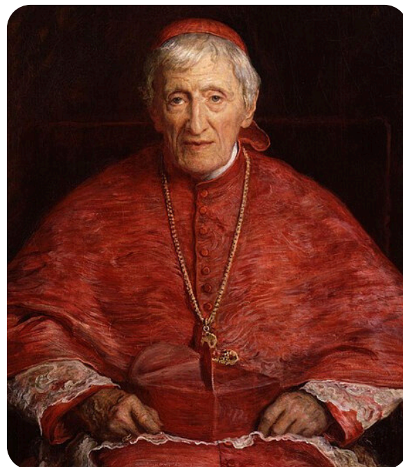
San John Henry Newman por Sir John Everett Millais

San John Henry Newman tomó el lema episcopal Cor ad cor loquitur (“El corazón habla al corazón”), entendiendo que el Señor nos salva hablando a nuestro corazón desde su Sagrado Corazón. Fue en la Sagrada Eucaristía, la mayor forma de alabanza a Dios, donde San John Henry Newman cultivó su encuentro más profundo con el corazón vivo de Jesús. Oremos con San John Henry Newman para que podamos escuchar al Sagrado Corazón que nos habla cuando alabamos y adoramos a Jesús en la Eucaristía.